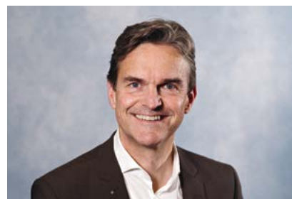
Nationalrat Dr. Beat Walti Eintritt 2008