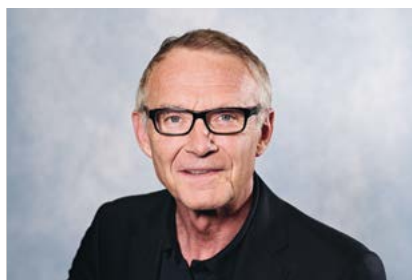
Urs Rohner Eintritt 2020