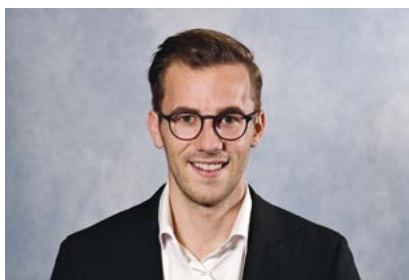
Nationalrat Andri Silberschmid-Buhofer Eintritt 2023